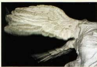
Dieter Huber, Pleasure File n° 13, 2000 . Tecnica digitale su tela, 55 x 92,5 cm.

La gioia e le emozioni positive che certe situazioni e certi oggetti suscitano in noi sono difficilmente comunicabili in quanto si tratta di esperienze del tutto personali. Lo sa bene Dieter Huber (1962), che con il suo progetto "Pleasure Files" —