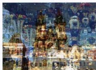
Davide Bramante, My Own Rave, Praga, 2005 . Elaborazione fotografica.

Intrecci di stili e culture, come di tempistiche e situazioni episodiche o fortuite. Stratificate e sovrapposte. Tra le operazioni fotografiche condotte da Davide Bramante, nato a Siracusa nel 1970, c'è il sommare in un singolo fotogramma immagini provenienti dalla stessa inquadratura, con quinte e sfondi metropolitani o paesaggistici. Gli scatti della mostra "Camera con vista", a cura di Ivan Quaroni, a prima vista appaiono frutto di un'arguta rielaborazione digitale, ma presto ne viene svelata la formulazione tecnica analogica generata da molteplici passaggi manuali. Le pareti positive che accolgono la