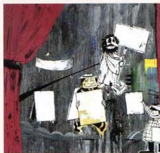
Thaddeus Strode, Signs, 2005 . Tecnica mista su tela, 228 x 271 cm.